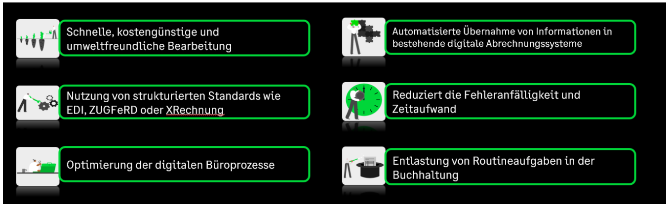
Abbildung 2: Vorteile zur Nutzung der E-Rechnung

Die Umstellung auf die E-Rechnung hilft Ihrem Unternehmen nicht nur die rechtlichen Aspekte zu berücksichtigen, sondern bietet zahlreiche Vorteile, Ihre Prozesse zu optimieren und Kosten zu senken.