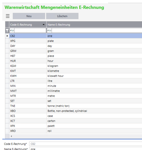
Abbildung 3: Anlage und Zuordnung der Mengeneinheiten in der Sage 100

Über Grundlagen können Mengeneinheiten der E-Rechnung mit ihren Schlüssel/Codes angelegt und zugeordnet werden. Die zugeordneten Codes werden bei Erstellung/Import in die XML-Datei übertragen bzw. erkannt.